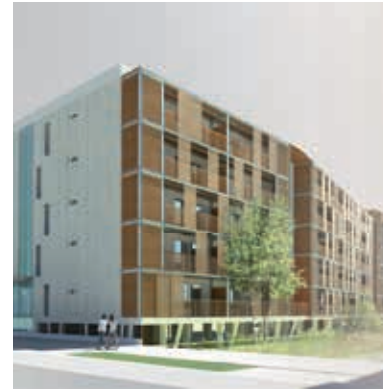
◀ Résidence Le Levant Thierry BOUTIN, architecte

Projet structurant d'un territoire en pleine évolution, il s'insère dans un vaste espace de pleine nature émaillé de jardins familiaux. Respectueux des caractéristiques du site, l'écoquartier Terre Sud se développe en favorisant la mobilité douce et en offrant ainsi tous les avantages de préservation du milieu.