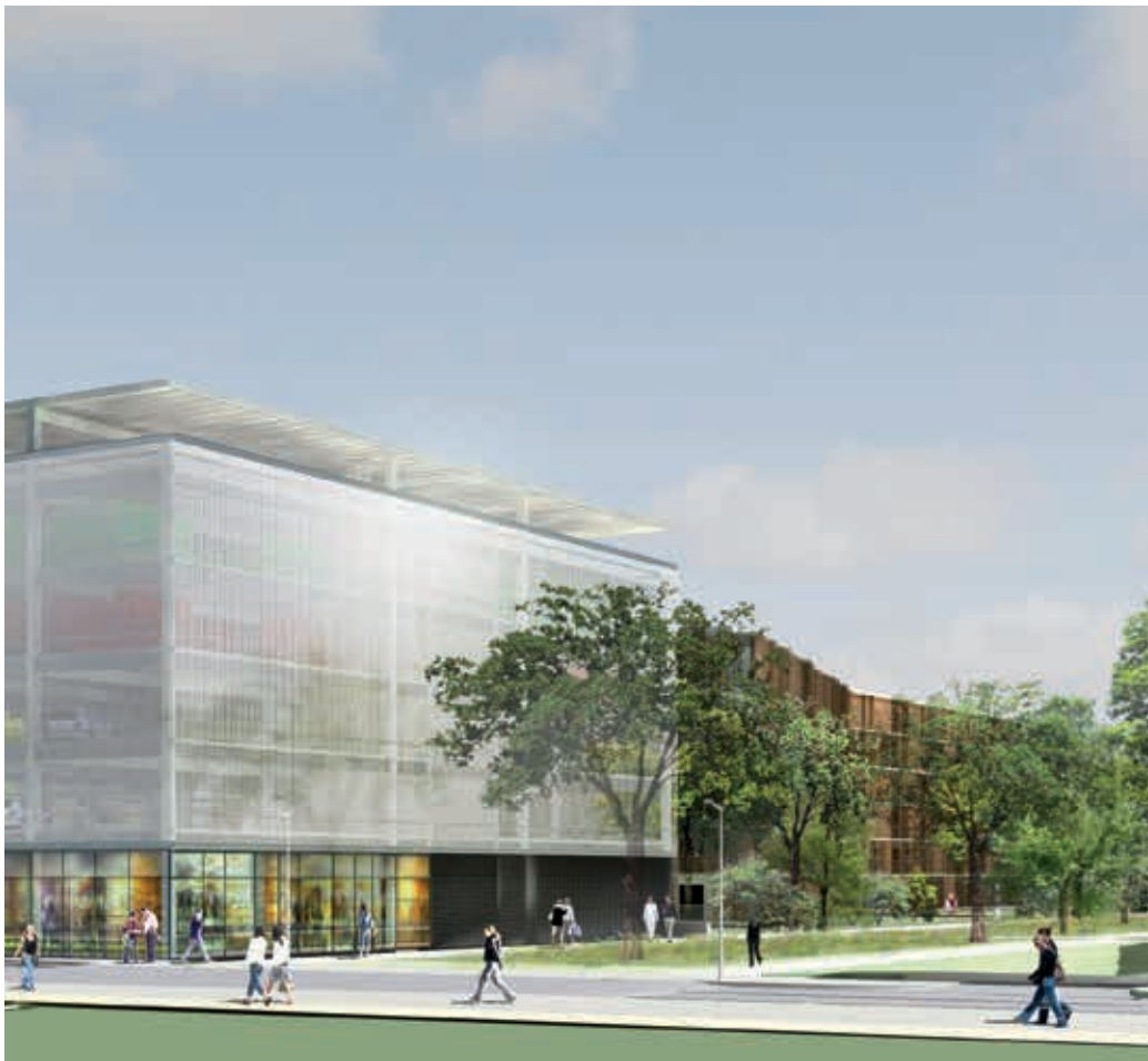
◀ Parking résidentiel Vue de jour

«...Pour libérer l'emprise au sol consacrée au stationnement des véhicules et privilégier les circulations douces au sein du quartier Terre Sud, un parking résidentiel étagé offrant 570 places a été réalisé. Outre l'économie d'espace, l'économie d'énergie est obtenue par un éclairage naturel traversant la peau en maille inox du bâtiment. La structure réversible permet si besoin d'autres usages....»