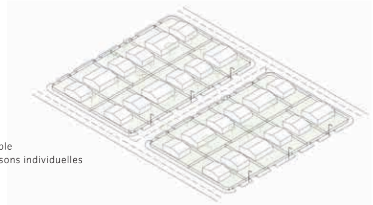
► Ensemble de maisons individuelles

Pour ce faire, quatre partenaires s'associent : la Ville de Bègles, le cabinet d'architecture Christophe Hutin, le groupe Lafarge et Domofrance. Le projet, sortant des standards du marché, propose des plateaux à vivre comprenant 50% de surface habitable, 25% de surface affectée en jardin et 25% de surface intermédiaire offrant une possibilité d'extension du bâti ou du jardin. Le principe du lotissement vertical repose sur une plus grande liberté donnée au futur accédant de concevoir son espace de vie.