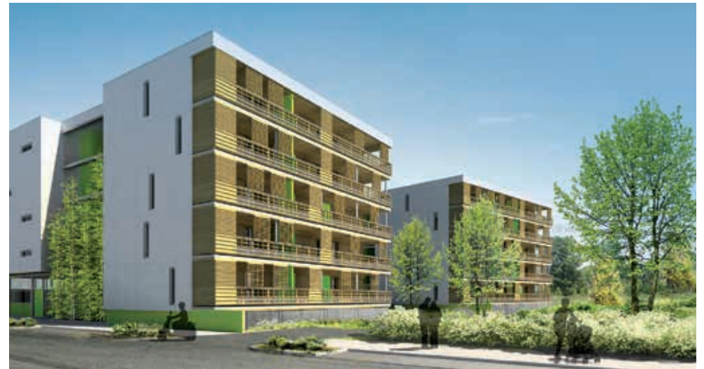
Résidence Le Ponant Atelier Fabrique