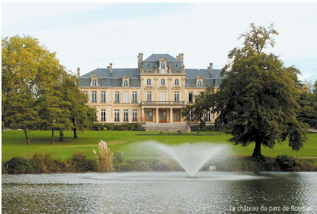
Le château du parc de Bourran