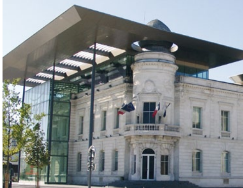
La Médiathèque de Mérignac

tels que sa Médiathèque, le Pin Galant, le Krakatoa ou la Vieille-Église Saint Vincent. Mérignac conjugue brillamment vitalité économique, qualité de vie exceptionnelle et richesse de ses équipements. Enfin, grâce au tramway, la ville jouit d'un accès rapide vers la zone commerciale de Mérignac Soleil et vers Bordeaux-centre.