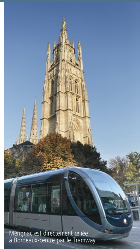
Mérignac est directement reliée à Bordeaux-centre par le Tramway

tels que sa Médiathèque, le Pin Galant, le Krakatoa ou la Vieille-Église Saint Vincent. Mérignac conjugue brillamment vitalité économique, qualité de vie exceptionnelle et richesse de ses équipements. Enfin, grâce au tramway, la ville jouit d'un accès rapide vers la zone commerciale de Mérignac Soleil et vers Bordeaux-centre.