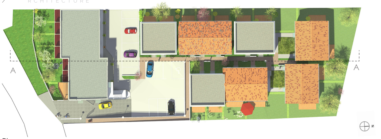
Plan masse Coupe détail